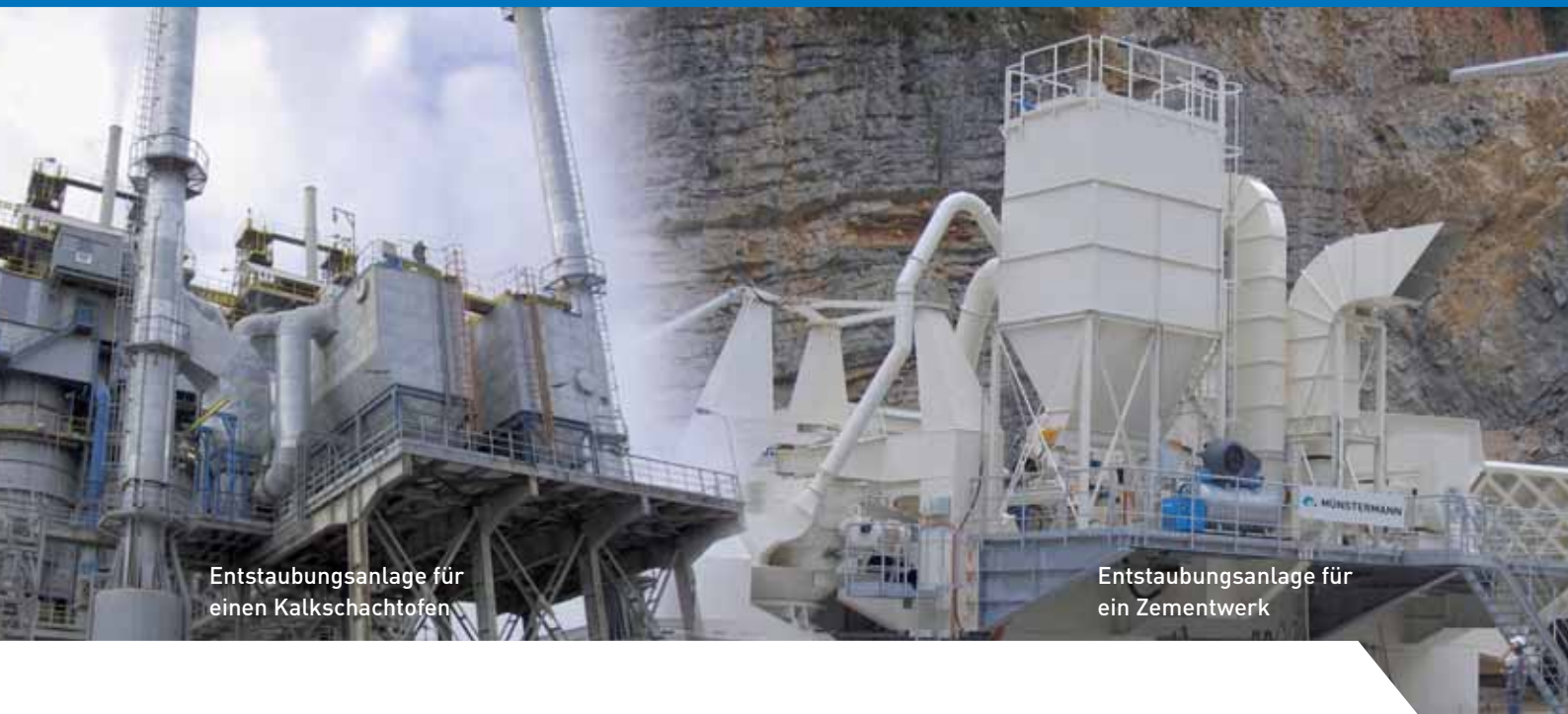
Entstaubungsanlage für einen Kalkschachtofen